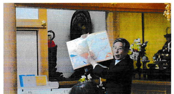
昨年のお十夜法要の様子